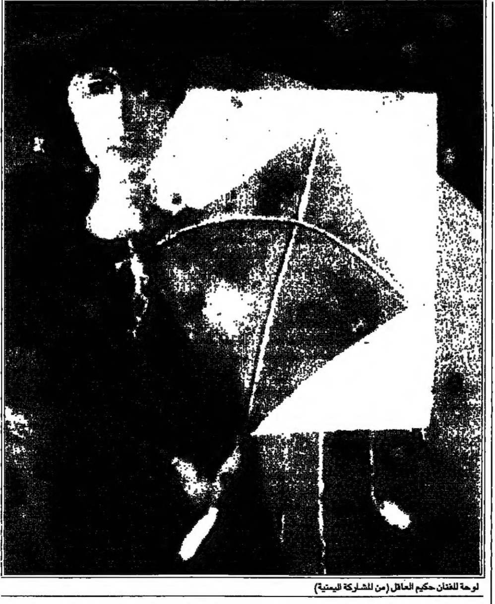
لوحة للفنان حكيم الخليل (من المشاركة اللبنانية)

وهي الاغنية الفلسطينية / وانا لو نسيبت اوطاني يا اخواني / انا ما استحق اعيش / ولا يوم تأتي / ازاوي وفلسطين ساكنة في وجداني / انسي بلادي ازاوي / واها تتسانيني.